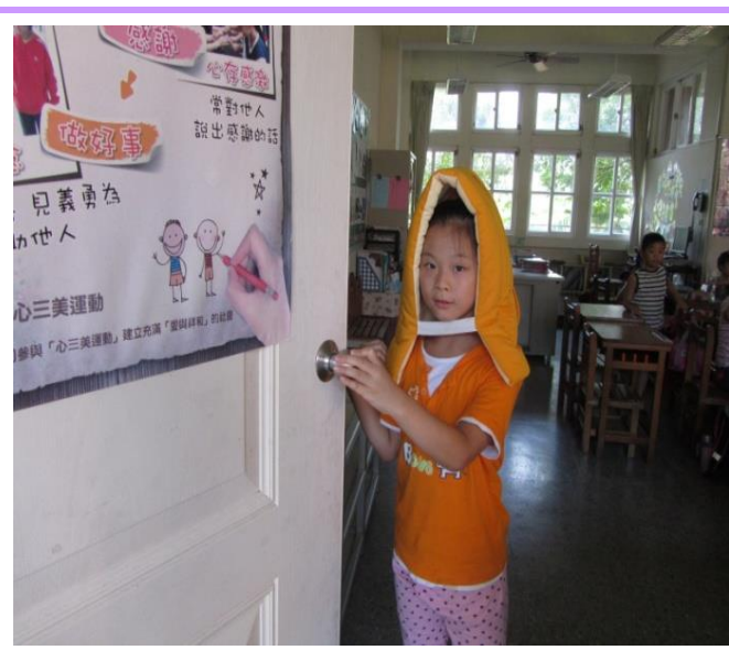
避難時的注意事項-開門