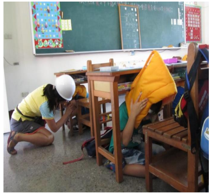
低年級老師指導學生就地避難