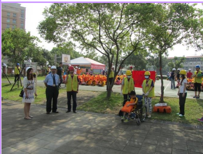
教育局長視導急救站